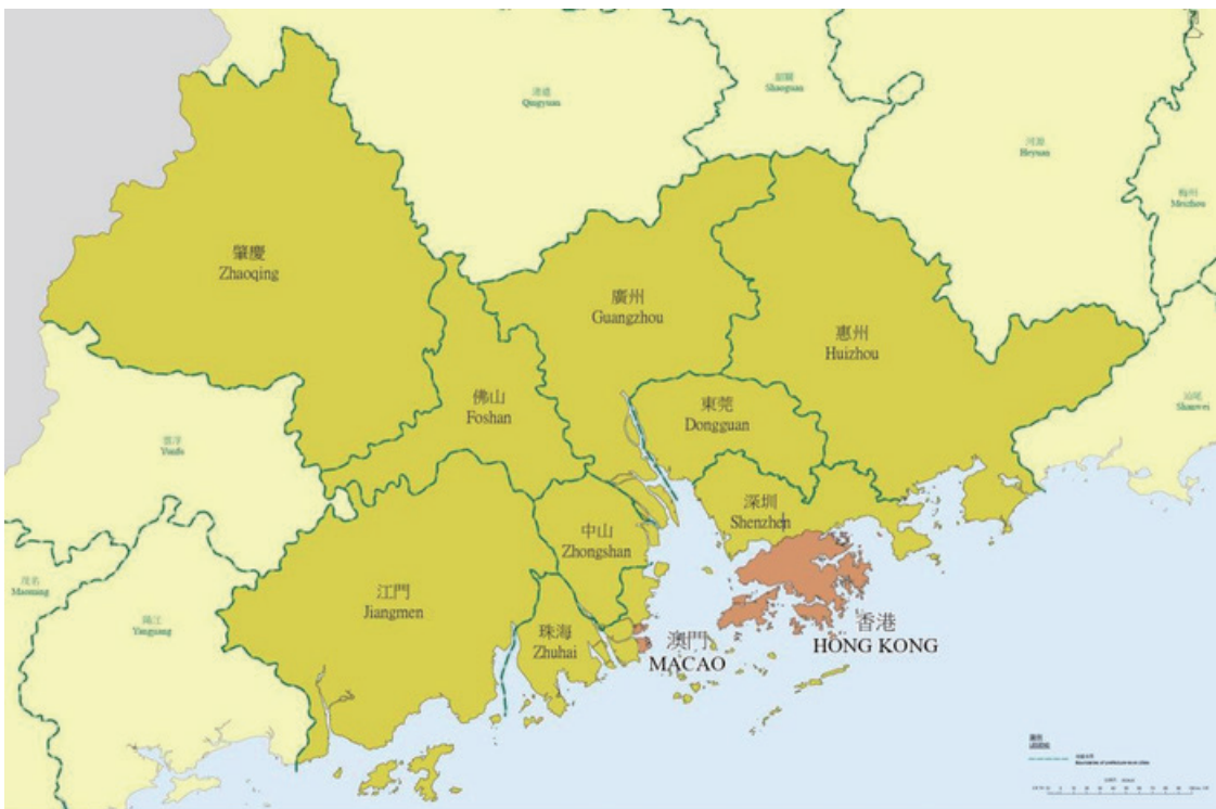
粵港澳大灣區 Guangdong - Hong Kong - Macao Bay Area