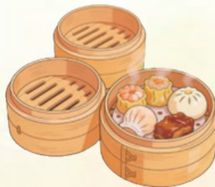
蒸籠製作技藝 茶樓點心製作技藝