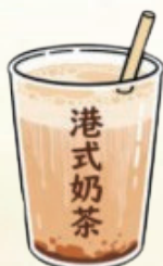
港式奶茶製作技藝